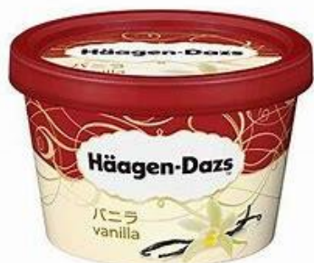
ハーゲンダッツ バニラ

※冷凍庫が付いていない所もございます。 ※フロント9番で注文をお受けいたします。