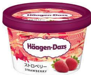
ハーゲンダッツ ストロベリー